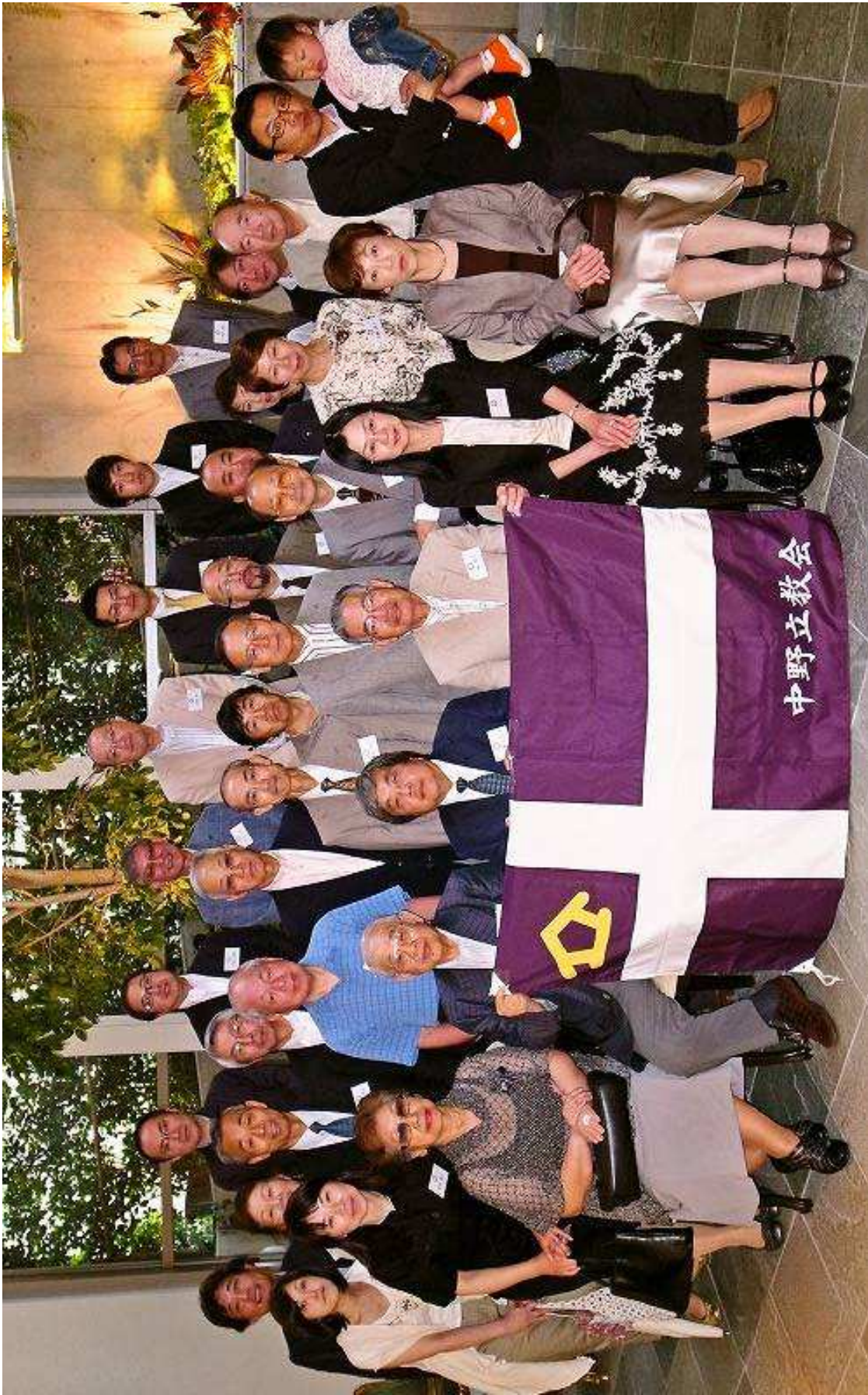
第29回中野立教会 総会 於：West53rd日本閣