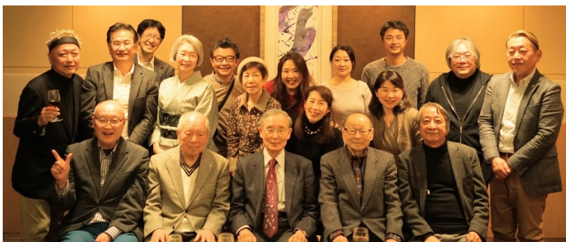
新年理事・幹事会集合写真